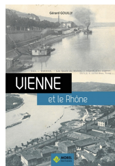
Livre sur l'histoire du Rhône (Vienne)